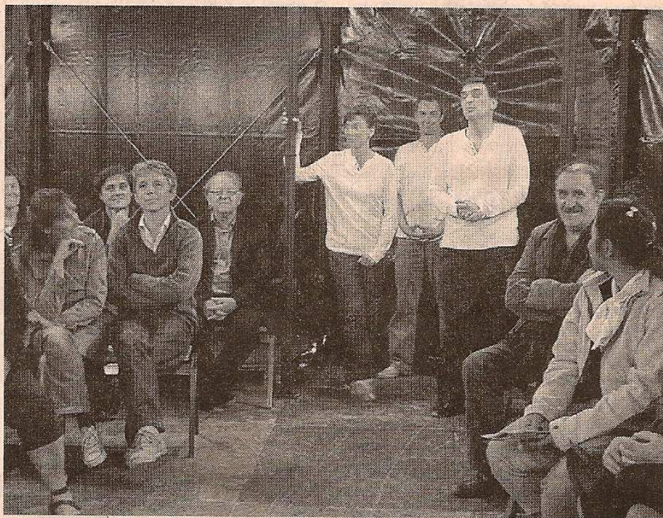
Trois comédiens pour une chronique de mort annoncée.

Festival des BiZZaroides. Dernier spectacle programmé : PPP, au THV, le mardi 4 mai, à 20 h 30. Renseignements, réservations au 02 41 96 14 90 ; www.thv.fr ; à l'accueil de l'Hôtel de ville.