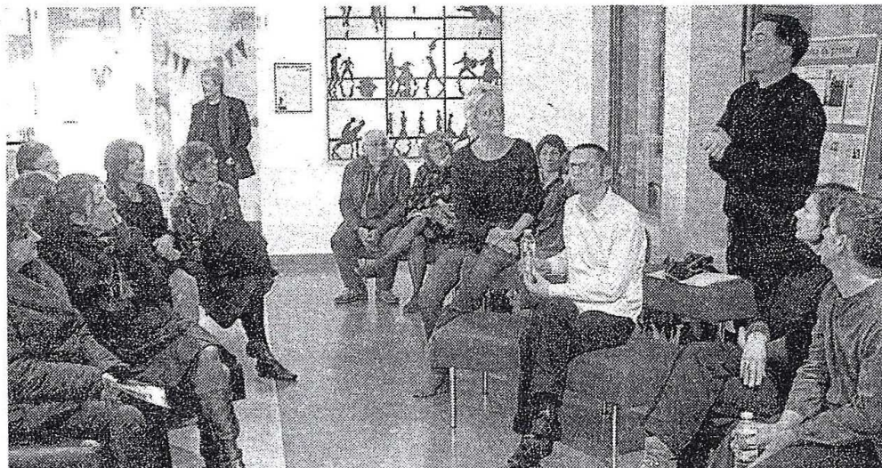
Dialogue avec le public, après la représentation.

Ils ont une douzaine d'années et s'appellent Aurore, Thomas, Saïd, Marie, Camille, Tarik... Ils sont vingt-quatre élèves de la 6 e B qui vont se réunir pour la photo de classe. Tout le talent des trois comédiens du Bibliothéâtre va être d'incarner avec beaucoup de justesse, les découvertes, les émois, les souffrances de ces enfants au seuil de l'adolescence.